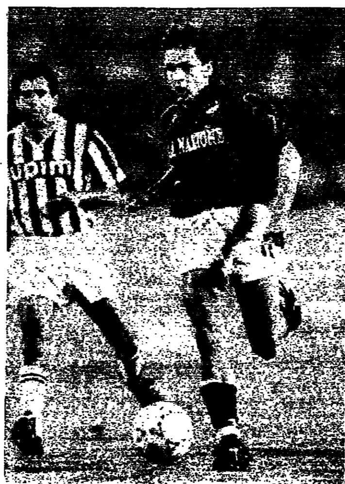
روبرتو باجيو خلال لقاء فريقه مع جوفنتوس

قال نادي جوفنتوس الإيطالي الحاصل على كأس الاتحاد الأوروبي لكرة القدم انه اشترى روبرتو باجيو لاعب خط الوسط في فيورنتينا مقابل ١٦ مليار ليرة (١٣ مليون دولار) وهو أكبر مبلغ يدفع لشراء لاعب كرة قدم.